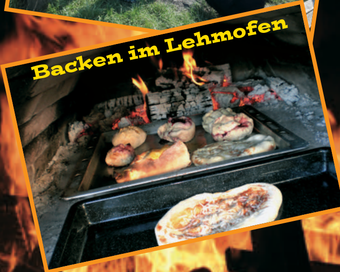
Backen im Lehmofen

Freitags wird auf dem Abenteuerspielplatz gegrillt und Stockbrot gemacht. Zudem gibt es gelegentliche Aktionen bei denen leckere Pizza im Lehmbackofen gebacken wird.