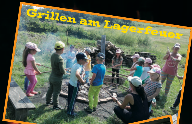
Grillen am Lagerfeuer